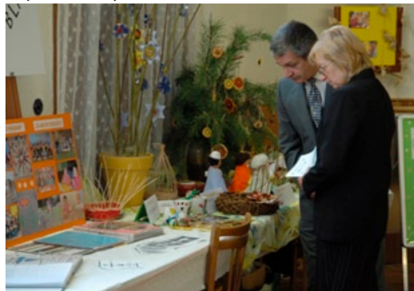
Vystavené práce zabraly celý sál.