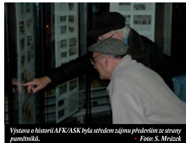
Výstava o historii AFK/ASK byla středem zájmu především ze strany pamětníků.

To je myšlenka, kterou propagují delší dobu. Myslím si, že pro tělovýchovu a sport ve městě by bylo prospěšné, když by bylo všechno pod jednou střechou. Snad s výjimkou velkých klubů fot-