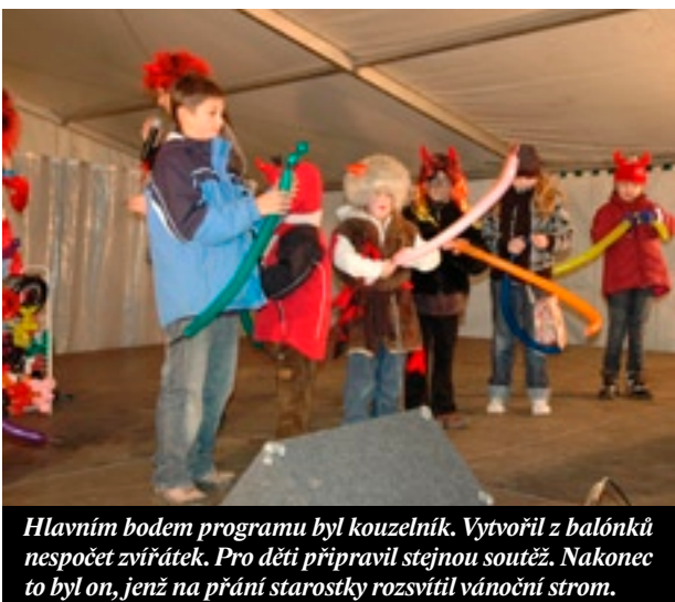
Hlavním bodem programu byl kouzelník. Vytvořil z balónek nespočet zvířátek. Pro děti připravil stejnou soutěž. Nakonec to byl on, jenž na přání starostky rozsvítil vánoční strom.