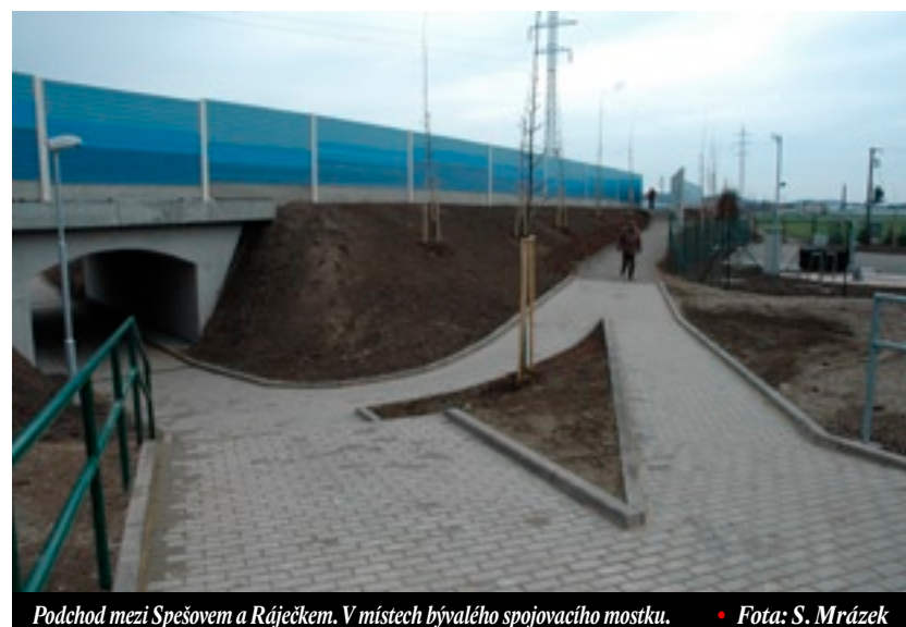
Podchod mezi Spešovem a Rájčkem. V místech bývalého spojovacího mostku.

III. stavba Rájčko – Spešov, červen 2008 – listopad 2009, 0,982 km, 120,690 mil. Kč