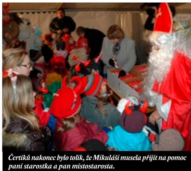
Čertíků nakonec bylo tolik, že Mikuláš musel přijít na pomoc paní starostka a pan místostarosta.