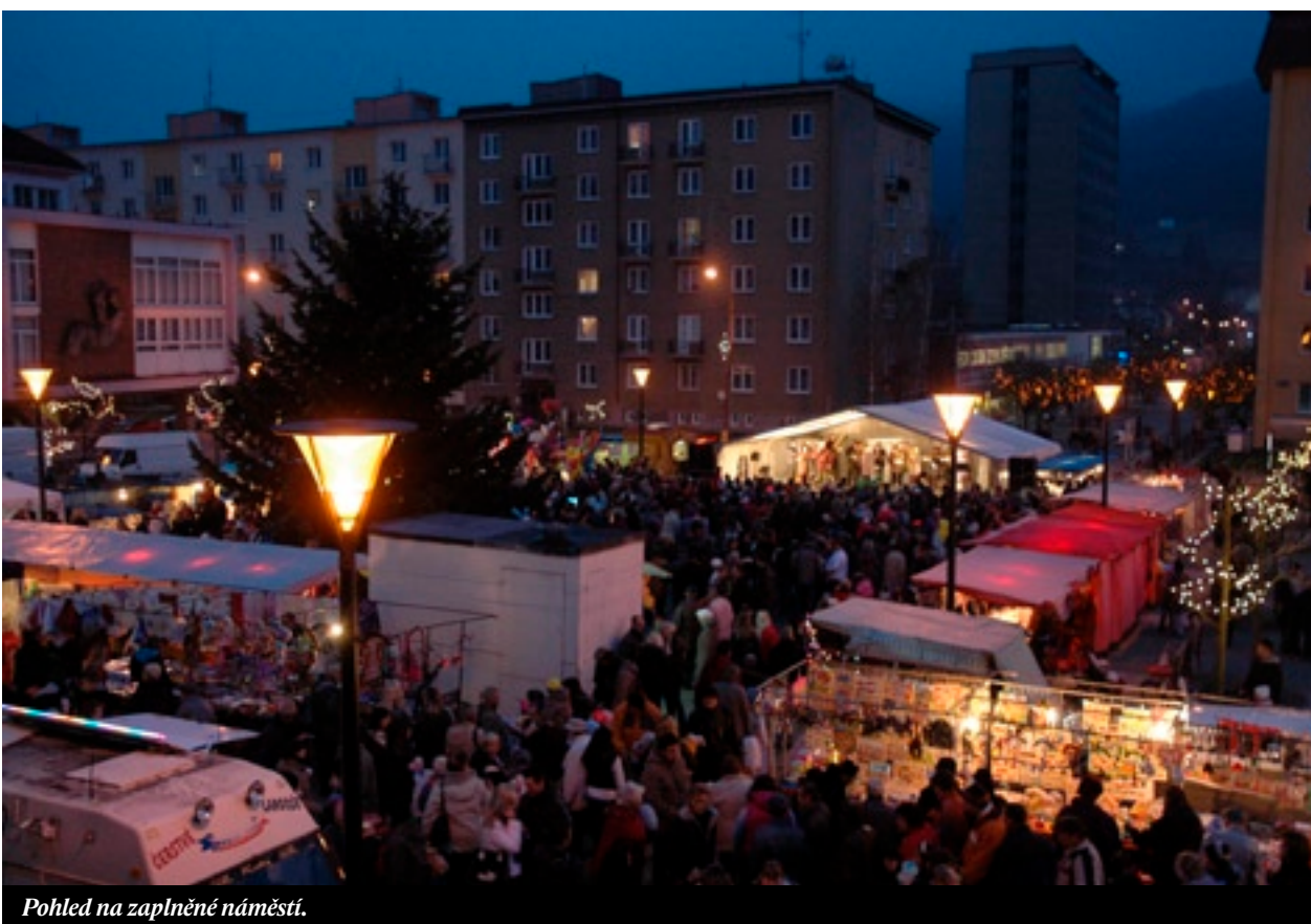
Pohled na zaplněné náměstí.