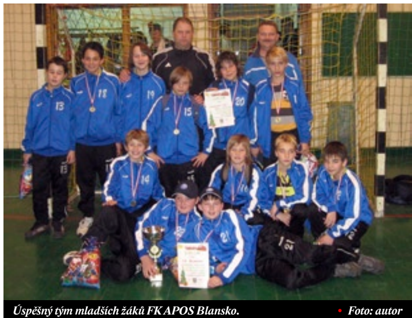
Úspěšný tým mladších žáků FK APOS Blansko.