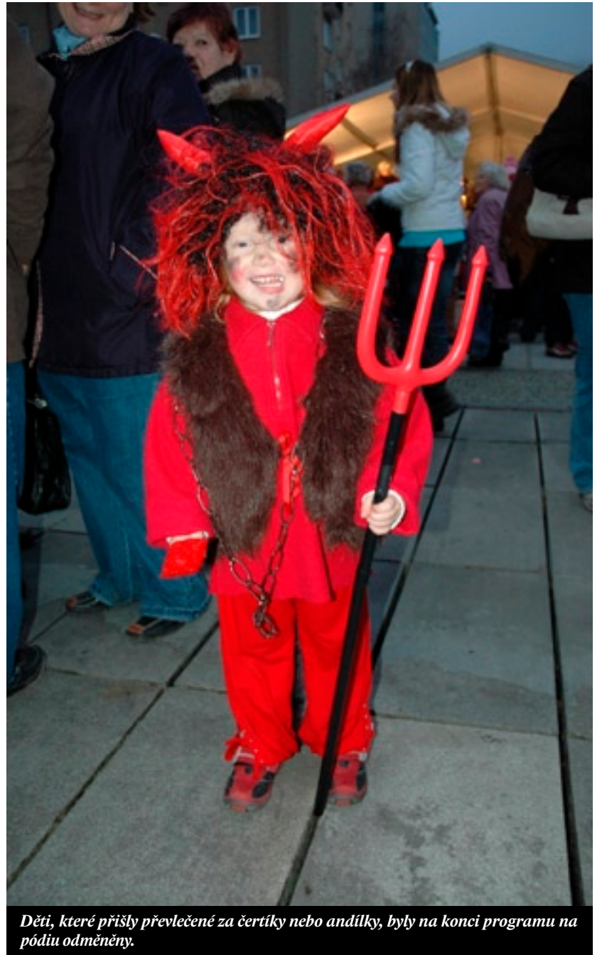
Děti, které přišly převlečené za čertíky nebo andělky, byly na konci programu na pódiu odměněny.