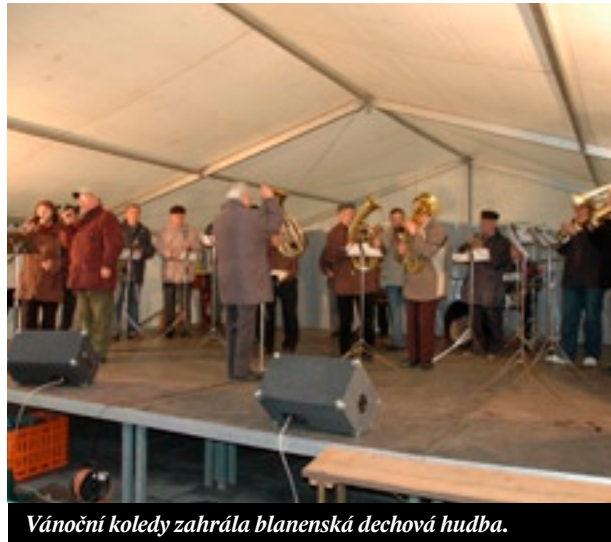
Vánoční koledy zahrála blanenská dechová hudba.