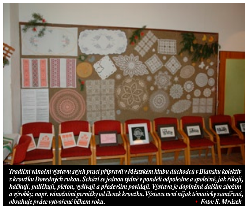
Tradiční vánoční výstavu svých prací připravil v Městském klubu důchodců v Blansku kolektiv z kroužku Dovedných rukou. Schází se jednou týdně v pondělí odpoledne a společně, jak říkají, háčkují, paličkují, pletou, vyšívají a především povídají. Výstava je doplněná dalším zbožím a výrobky, např. vánočními perníčky od členek kroužku. Výstava není nějak tématicky zaměřená, obsahuje práce vytvořené během roku.