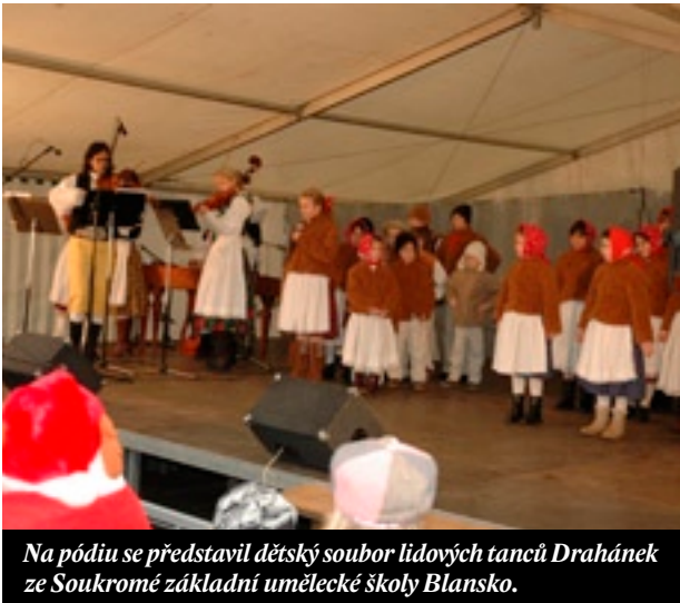
Na pódiu se představil dětský soubor lidových tanců Drahánek ze Soukromé základní umělecké školy Blansko.

Více jak měsíční přípravy na slavnostní rozsvícení vánočního stromu byly nakonec korunovány předvánočními trhy na celém náměstí Republiky a bohatým programem zaměřeným především na děti.