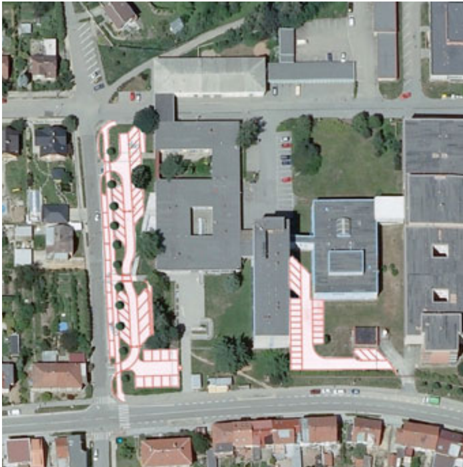
Nově realizovaná parkovací stání u Nemocnice Blansko – v současné době zrealizované parkoviště na ulici K. H. Máchy a výhled dalšího parkování v areálu nemocnice.

Právě realizovanou výstavbou parkoviště na ulici K. H. Máchy dojde k rekonstrukci a rozšíření parkovacích ploch u nemocnice Blansko. Celkem vznikne 48 parkovacích stání pro parkování osobních automobilů návštěvníků nemocnice s poliklinikou.