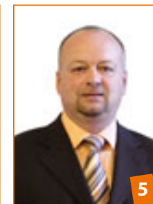
Mgr. Ivo Polák náměstek hejtmána Jihomoravského kraje, 52 let