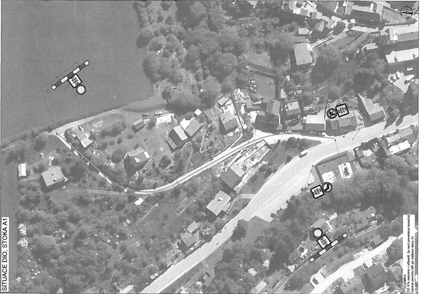
SITUACE DIO, STOKA A1

POZNÁMKA DZ A7a osazeno v případě, že není provedena konečná úprava povrchu MKK po realizaci sítě A1