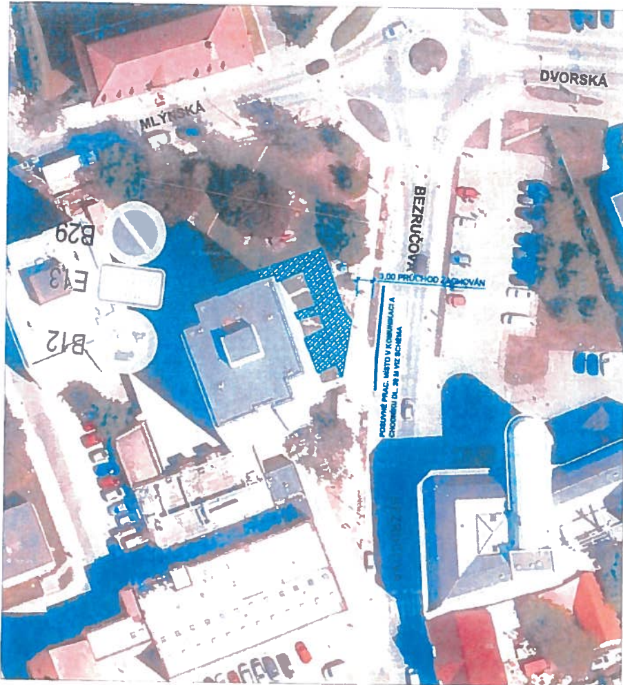
SCHÉMA POSUVNÉ PRAC. MÍSTO V KOMUNIKACI A CHODNÍKU UL. BEZRUČOVA