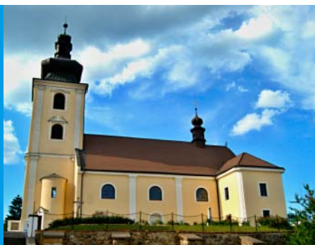
Kostel sv. Martina

Je jedním ze šesti dřevěných kostelíků převezaných do naší republiky z Podkarpatské Rusi. Pochází z Nižného Seliště, je postaven ve stylu rusínské gotiky a zasvěcen sv. Paraskevě. Jeho stavba byla zahájena v roce 1601, dokončena v roce 1641 a do Blanska byl vlakem převezen v roce 1936, kde byl během tří měsíců znovu sestaven. Stavbě dominuje štíhlá čtyřboká věž se čtyřmi nárožními věžičkami, interiér kostelíka zdobí původní pravoslavné ikony.