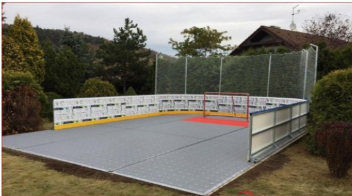
Obrázek 4 Návrh možného výchozího stavu

Předpokládané náklady činí cca 500 000 Kč. Je zapotřebí investovat do kvalitní povrchové úpravy podlahy, tak aby byla co nejšetrnější, zmírňovala případné pády, poskytovala efektivní trénink a také aby měla dlouho životnost.