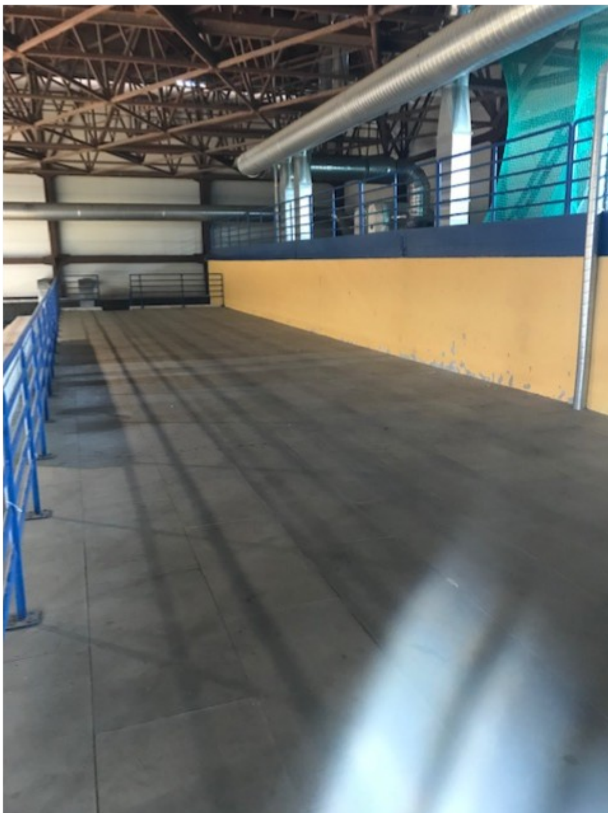
Obrázek 3 Pohled na plochu pro víceúčelové hřiště II

Předkládaný projekt je v souladu se strategickými a koncepčními dokumenty města. Konkrétně je projekt v souladu se Strategickým dokumentem města Blanska ( str. 9 B.9 )