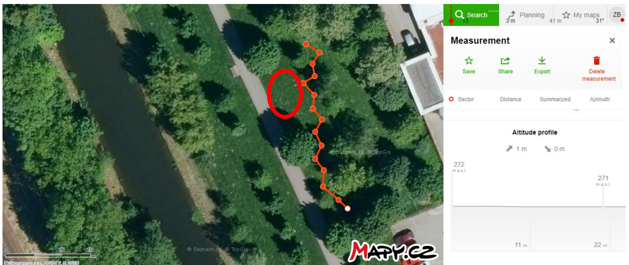
Orientační umístění lanových překážek (dle technických možností na této ploše mezi stromy), v oválu umístění laviček

Navrhované řešení by se týkalo jednak rodin s dětmi (u nízkých lanových drah se obvykle uvádí věk 3-14 let - předpokládané využití by tedy bylo i pro starší děti a dorost), ale celkově bych očekávala zatraktivnění lokality i pro ostatní skupiny občanů díky přidání otočných laviček a vytlačení nepřizpůsobivých občanů. Vzhledem k limitaci rozpočtem není možné nyní podat návrh tak, jak bych jej viděla komplexně (na druhé straně cyklostezky veřejné grilovací místo a vodní herní prvky).