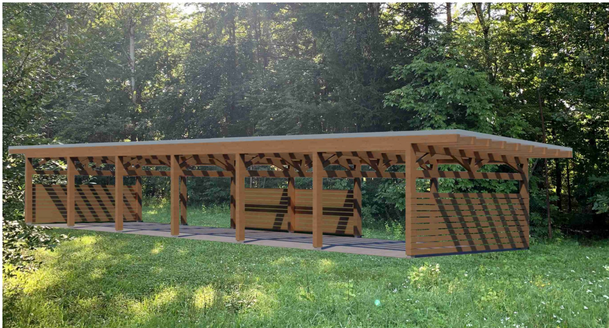
Grafický návrh projektu